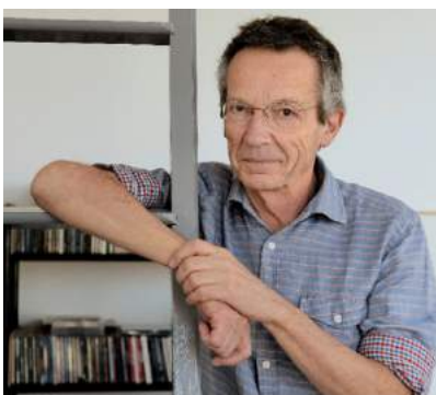
Patrice Leconte, Grand Parrain de PSE

Lauréate du Prix des Droits de l'Homme de la République Française en 2000 et du 1 er prix Humanitarian Heroe of the Year 2014, l'association est reconnue Association de Bienfaisance.